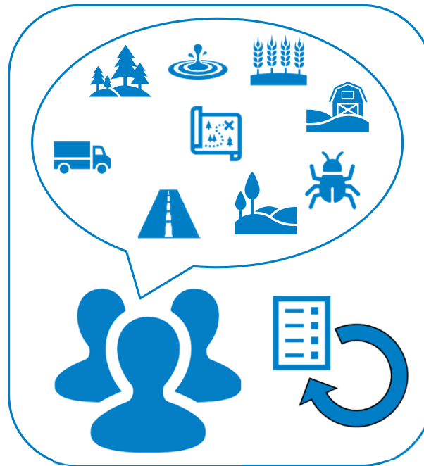
2. Interessenbewertung und -optimierung